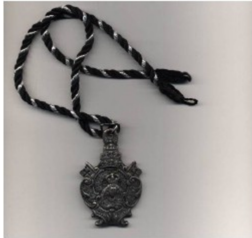
Pontificia y Real